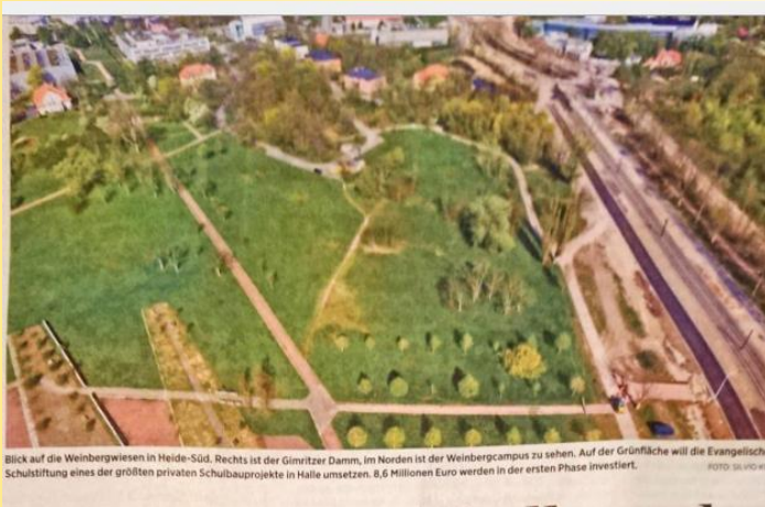
Blick auf die Weinbergwiesen in Heide-Süd. Rechts ist der Gimritzer Damm, im Norden ist der Weinbergcampus zu sehen. Auf der Grünfläche will die Evangelische Schulstiftung eines der größten privaten Schulbauprojekte in Halle umsetzen. 8,6 Millionen Euro werden in der ersten Phase investiert.

Im Sommer bewilligt die Stadt Halle den Verkauf eines großen Grundstücks an unsere Schulträgerin, die Evangelische Schulstiftung in Mitteldeutschland, welche nun die Möglichkeit sieht, auf dem deutlich zentraleren Gelände einen Grundschulneubau sowie mittelfristig eine weiterführende Schule zu errichten. Wir sind damit unserer gemeinsamen Vision eines Evangelischen Schulzentrums mit reformpädagogischer Ausrichtung einen großen Schritt näher gekommen!